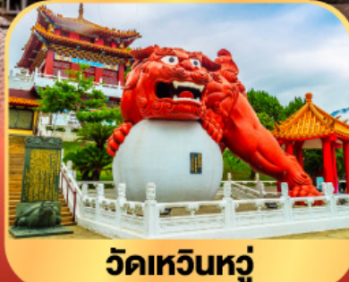
วัดเหวินหลู่