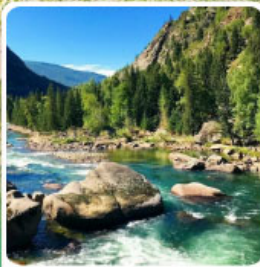
อุทยานเคอเคอทั้วไห้