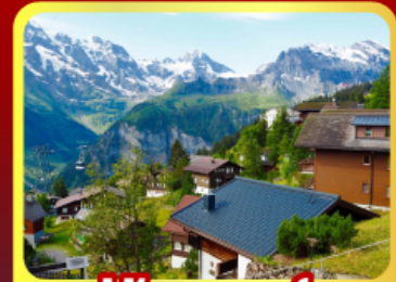
หมู่บ้านมอร์ริสัน