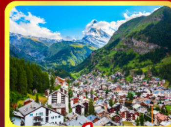
เชอร์แมนท์