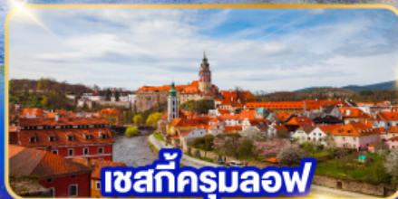
เซสท์ครมอฟ