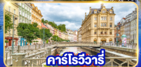
คาร์โรวาร์