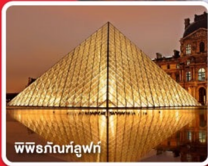
พีระภินท์ลูฟท์