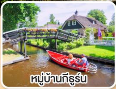
หมู่บ้านทีร์ูร์น