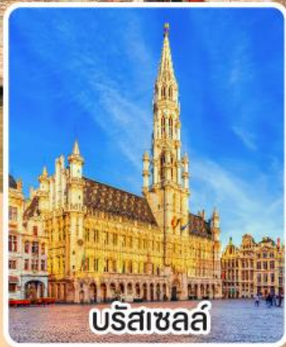
บรัสเซลส์