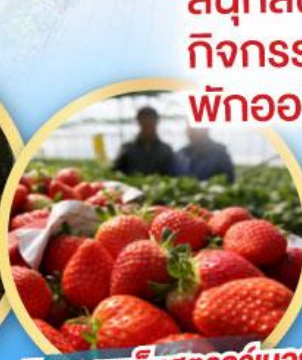
กิจกรรมเก็บสตอว์เบอร์รี่