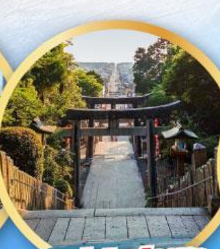
ศาลเจ้ามียาจิดากะ