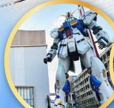
กันดั้ม ปาร์ค ฟุคุโอกะ