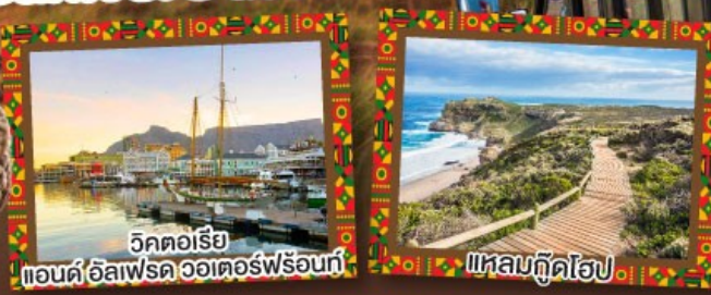
วิกตอเรีย แอนดริวเฟรดวอเตอร์พร้อนท์

เปิดประสบการณ์กับทัศนคาร Canivore สวรรค์ของคนรักเนื้อสัตว์