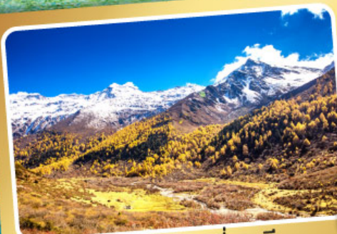
อุทยานภูเขาสั่ดรุณี