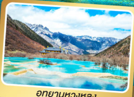
อุทยานหองหลง