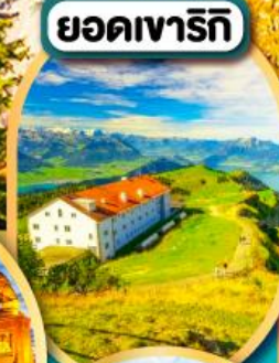
ยอดเขารีกี