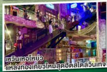
ช้อปปิ้งไฮโซ ที่แหล่งท่องเที่ยวใหม่สุดฮิตสไตล์ลันเตง