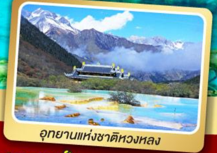
อุทยานแห่งชาติหลวงหล