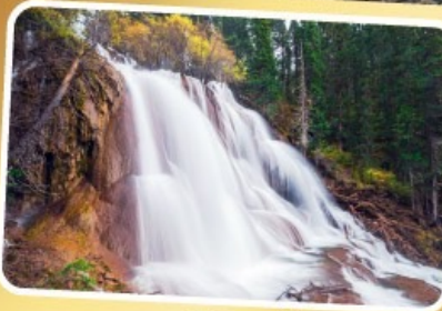
อุทยานไท่หวหนี่โกว