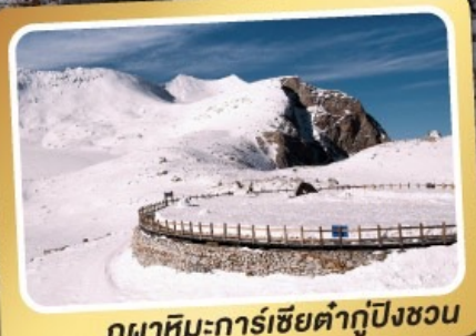
ภูเขามะกลาเซียร์ต้ากู่ปิงชว่น