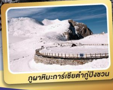
อุทยานหิมะกลาเซียร์ต้ากู่ปิงชวณ