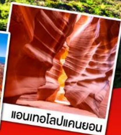
แอนเทโบลแคนยอน