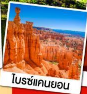
โบรซ์แคนยอน