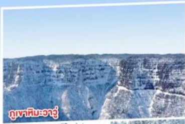
ภูเขาหิมะวาอู๋