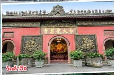
วัดต้าเจี๋ย