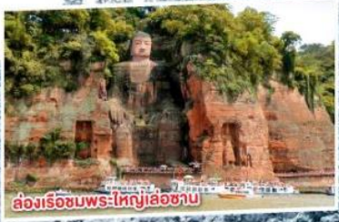
ล่องเรือชมพระใหญ่เล่อซาน