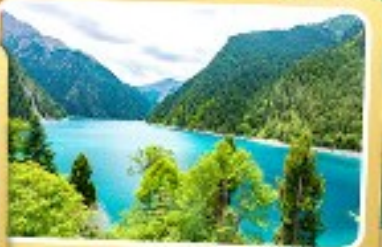
ทะเลสาบยาว