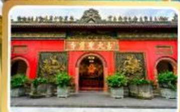
วัดต้าฉือ