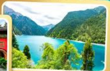
ทะเลสาบยาว