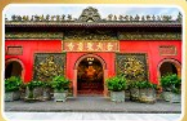
วัดต้าอื่อ