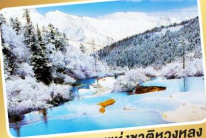
อุทยานแห่งชาติหลวง

เที่ยวได้ทั้งปี หลวง หลวง จิวจ้ายโกว Snow Winter 7 วัน 6 คืน