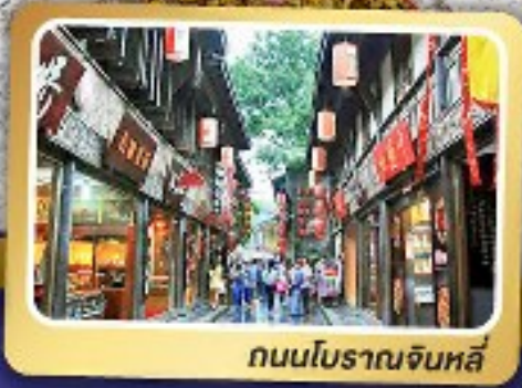
ถนนโบราณจิ้นหลี่