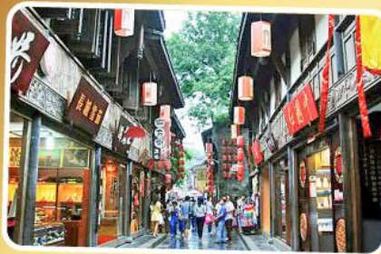
ถนนโบราณจีนลี่