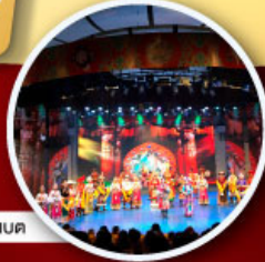
ชมโชว์ริบเบต