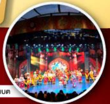
ชมโชว์ริบเบค

* พักโรงแรม 4-5 ดาว * เที่ยวจุใจ..ไม่ลงร้านช้อปปิ้ง