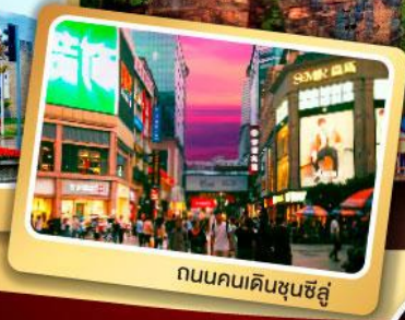
ถนนคนเดินซุนซีลู่