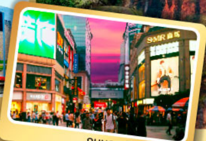
ถนนคนเดินซุนชี่ลู่

* พักโรงแรม 4-5 ดาว * เกี้ยวจุใจ..ไม่ลงร้านช้อปปิ้ง