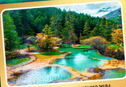
อุทยานหลวงหลง

เจ๋งตุ๋น งดงาม คือคำขวัญ เล่าตำนาน งงไป 8 วัน 7 คืน