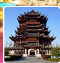
วัดดงหยวน