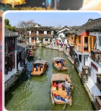
หมู่บ้านโบราณจูเจียเจียว