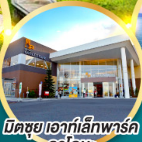
มิตรชยุเอากะอิเคฮาร์ค คาโดมะ