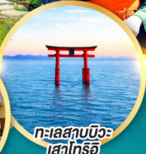
ทะเลสาบบิวะ เสาโทริอิ

เส้นทางสายอัลไพน์ทากายามา กำแพงหิมะ เพื่อนคู่โรเบะ