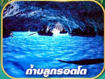
ถ้ำบลูกรอตโต