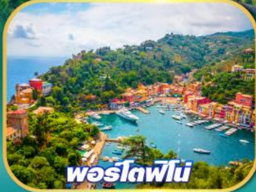
พอร์ตฟีโน