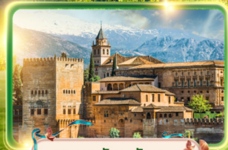
พระราชวังอัลฮัมบรา