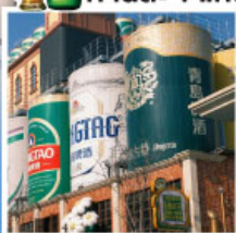
พิพิธภัณฑ์โรงเบียร์ชิงเต่า