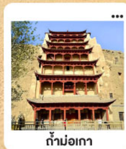
ถ้ำม่อเกา