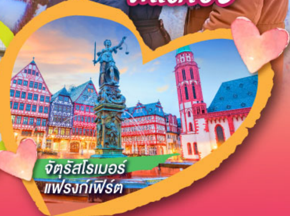
จัตุรัสโรเมอร์ แฟรงก์เฟิร์ต