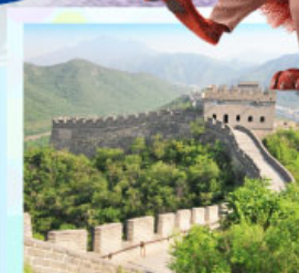
ตลาดร้อยปีเฉิงหวงเมี่ยว กำแพงเมืองจีน ด่านจวิ๊ยกทว