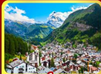
เซอ์นเมท