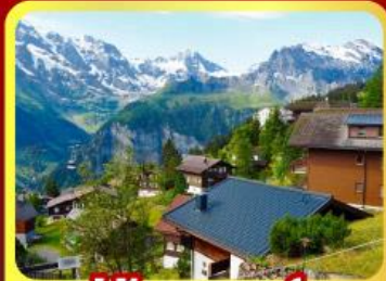
หมู่บ้านเมอร์เรน