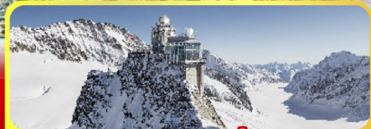
ยอดเทวจุ่งเฟรา