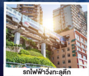
รถไฟฟ้าวิ่งทะลุคิก

พระหินแกะสลักคำจู้ หลุมบ่อฟ้าสะพานสวรรค์ เจ้านางฟ้า อุทยานสี่ครุณี อุทยานปี้ผิงโกว