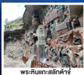
พระหินแกะสลักคำจู้