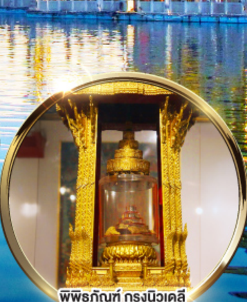
พิพิธภัณฑ์ กรุงนิวเดลี กราบนมัสการพระบรมสารีริกธาตุ