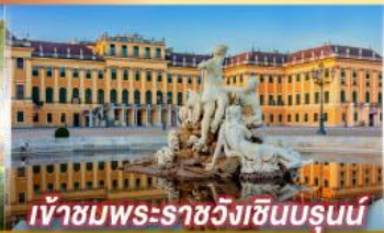
เข้าชมพระราชวังฮินรุนน์