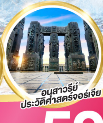
อนุสาวรีย์ ประวัติศาสตร์จอร์เจีย