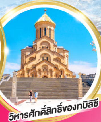
วิหารศักดิ์สิทธิ์ของทบิลีซี