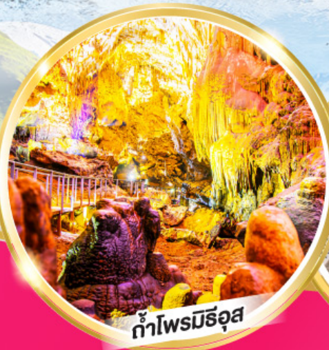
ถ้ำไฟรมีริอุส