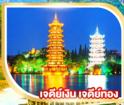
เจดีย์เงิน เจดีย์ทอง