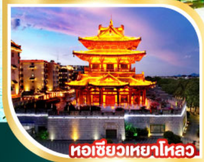
หอเซียวเหยาไหลว