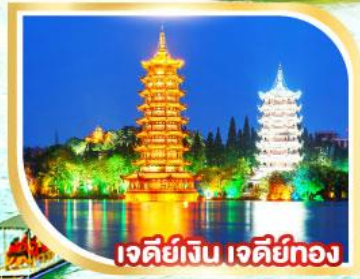
เจดีย์เงิน เจดีย์ทอง