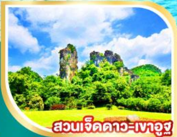
สวนเจ็ดดาว-เกาอูซู