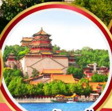
พระราชวังฤดูร้อน อ้อหอยวน