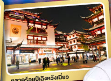
ตลาดร้อยปีเฉิงหวงเหมียว