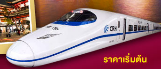
ราคาเริ่มต้น