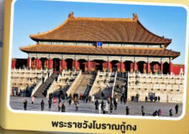
พระราชวังโบราณกู้กง