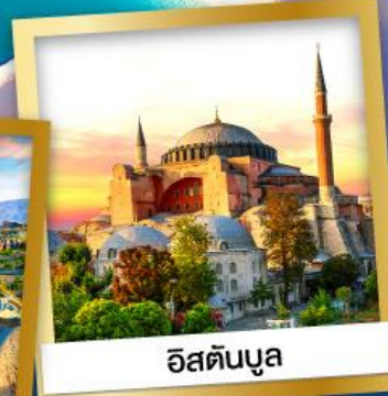
อิสตันบูล