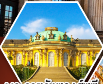
พระราชวังของสึซึ