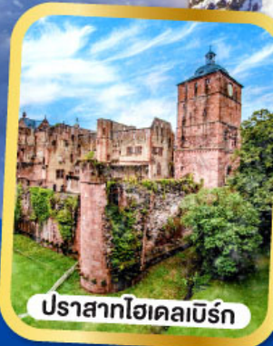
ปราสาทไฮเคลเบิร์ก