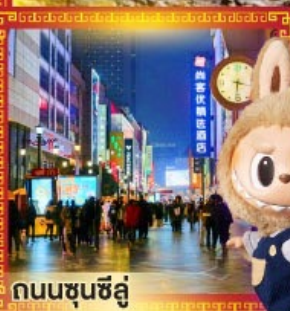
ถนนซุนซีลู่