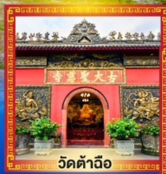
วัดต้าฉิว