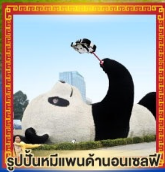
รูปปั้นหมีแพนด้าอนเซลฟี