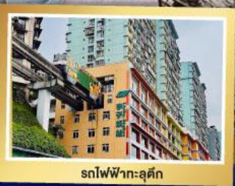
รถไฟฟ้า-ลู่ตัก