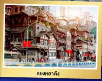
หยงหยาดัง