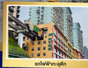
รถไฟฟ้า-ลูตัก