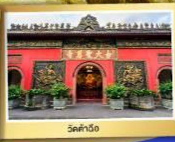
วัดต้าเจี๋ย