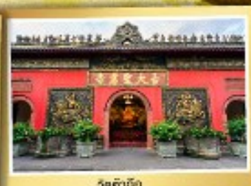
วัดต้าเจี๋ย