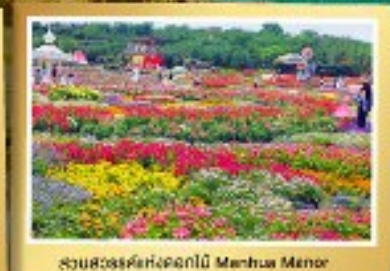
สวนสวรรค์ดอกไม้สีฤดู Mianhua Menor