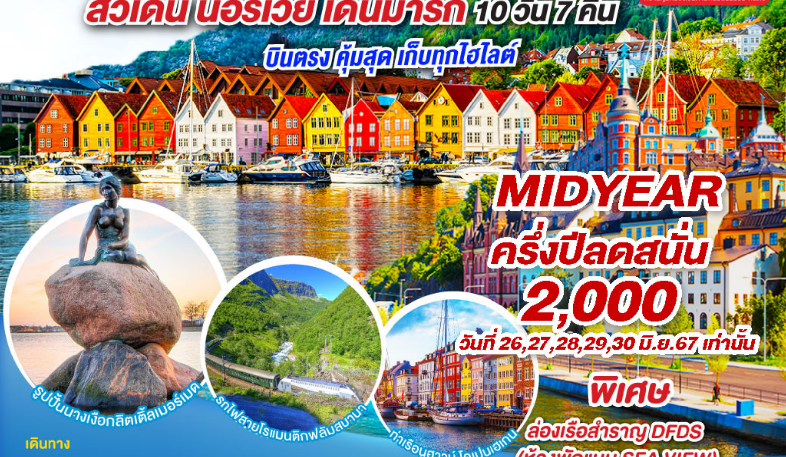
รูปปั้นนางเงือกลิตเติลเมอร์เมด