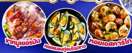
ขาหมูเยอรมัน