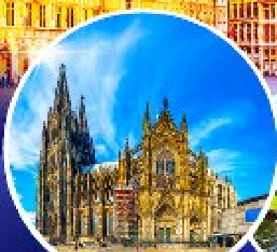
มหาวิหารแห่งโคโลญ