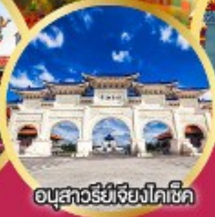
อนุสาวรีย์เจียงไคเช็ค