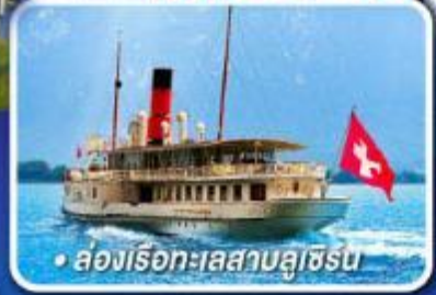
• ล่องเรือทะเลสาบลูซิเิร์น