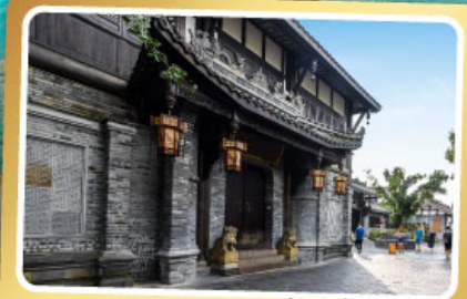
ถนนควานโจ๋เซียงจื่อ