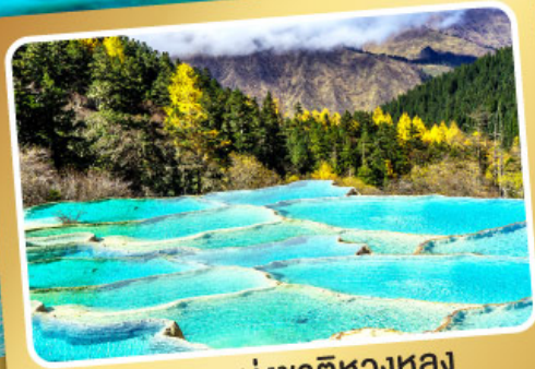
อุทยานแห่งชาติหวงหลง