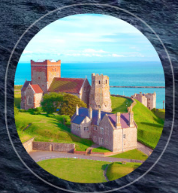
United Kingdom Dover

ราคา รวม : อาหารทุกมื้อบนเรือสำราญ, ทัปพนักงานบนเรือ, ท่าอากาศยาน | ราคาไม่รวม : ตั๋วเครื่องบิน, ค่าทำวีซ่า, ภาษีเตรียมบนฝั่ง