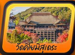
วัดคิโยมิสุเดะะ

พักฟูจิออนเซ็น 1 คืน กิฟุ 1 คืน โทยาม่า 1 คืน นาริตะ 1 คืน