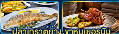
ปลาเทราต์ย่าง, จาห์มูเยอรมัน