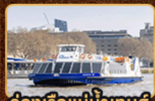
ล่องเรือแม่น้ำเทมส์