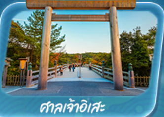
ศาลเจ้าอิสะ

12 - 17 พ.ค. 69 / 19 - 24 พ.ค. 69 26 - 31 พ.ค. 69 / 2 - 7 มิ.ย. 69 9 - 14 มิ.ย. 69