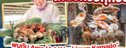
พบกับ Ama Hut "Haohiman Kamado" เมนูพิเศษ SEA FOOD

✈️ สายการบิน AirAsia X (XJ) น้ำหนักกระเป๋า 20 KG